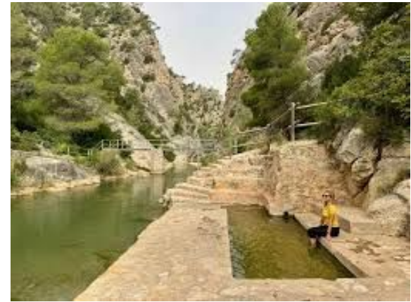
Piscina termal de La Fontcalda (Cataluña)