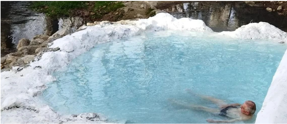
Baños de Alhama de Granada (Andalucía)