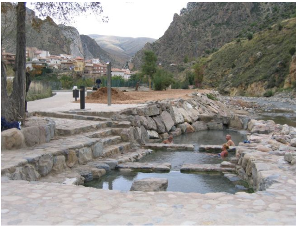
Pozas de Arnedillo (La Rioja)