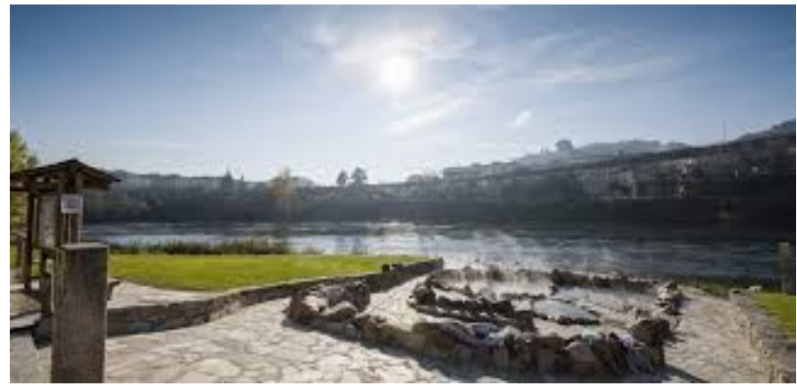
Termas A Chavasqueira (Galicia)