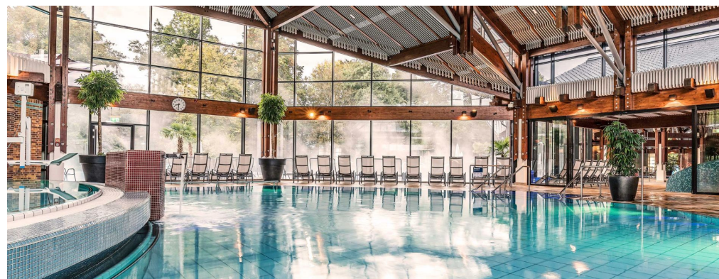
Termas Keidel Bad de Freiburg